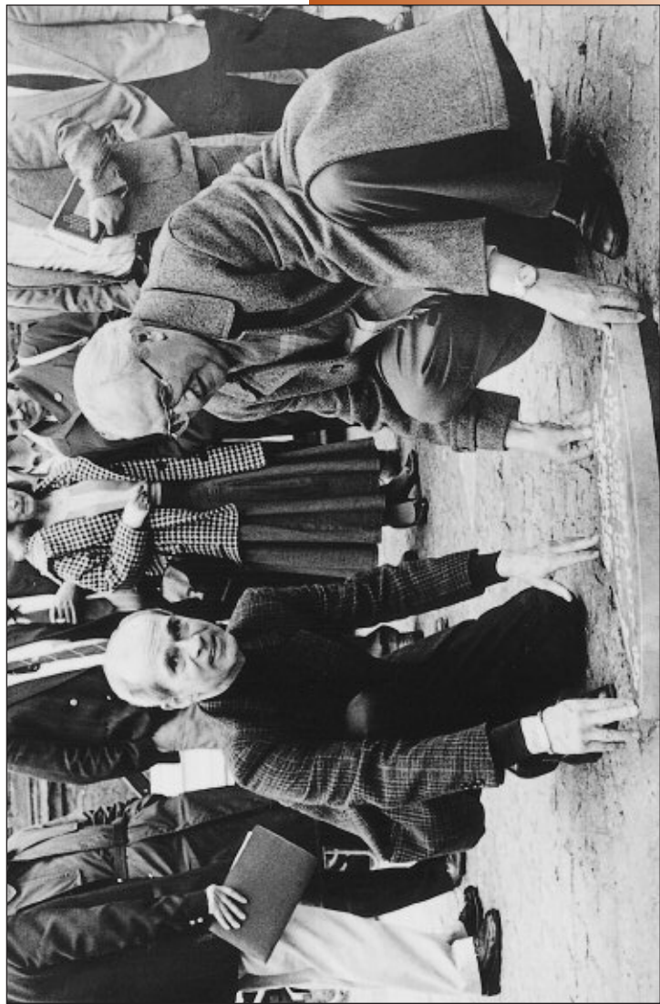
Met acteur Henk van Ulsem, tijdens de eerstelegging voor de dichteres Ida Gerhardt, op 16 april 1987. Drie Kampers; vandaag de dag alle drie in steen geëerd...